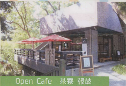
Open Cafe 茶寮 報鼓

国内屈指のパワースポット One of Japan's foremost power spots