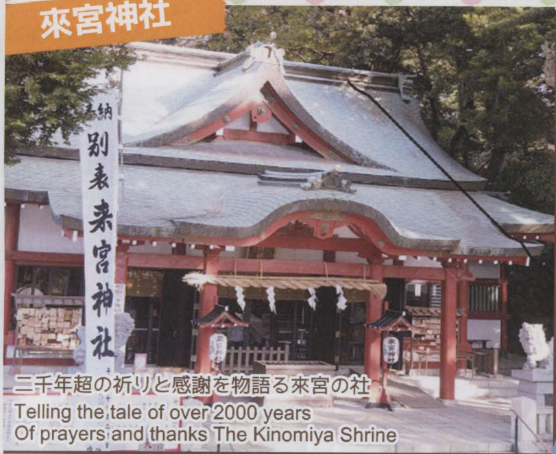
三千年超の祈りと感謝を物語る來宮の社 Telling the tale of over 2000 years Of prayers and thanks The Kinomiya Shrine