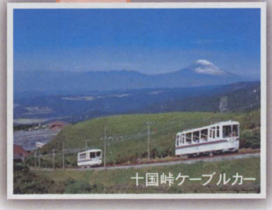
十国峠ケーブルカー