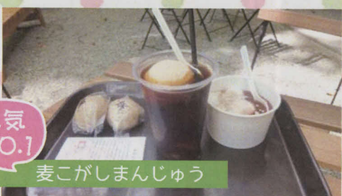
人気 NO.1 麦こがしまんじゅう