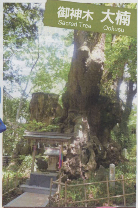
御神木 大楠 Sacred Tree Ookusu

樹齢 2000 年超 周囲 23.9m 高さ約 26m Over 2000 years old with a circumference of 23.9m and a height of approximately 26m