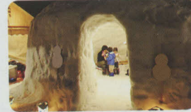
「かまくら」で雪国を満喫!

賽の神(どんと焼き) 1月15日頃、小正月行事として、しめ縄やお札、正月飾り、子供たちの習字などを火の中に入れて燃やし家内安全・健康や学業上達等を願います。各地で行われます。