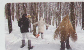
スノーシューでフィールド散策!