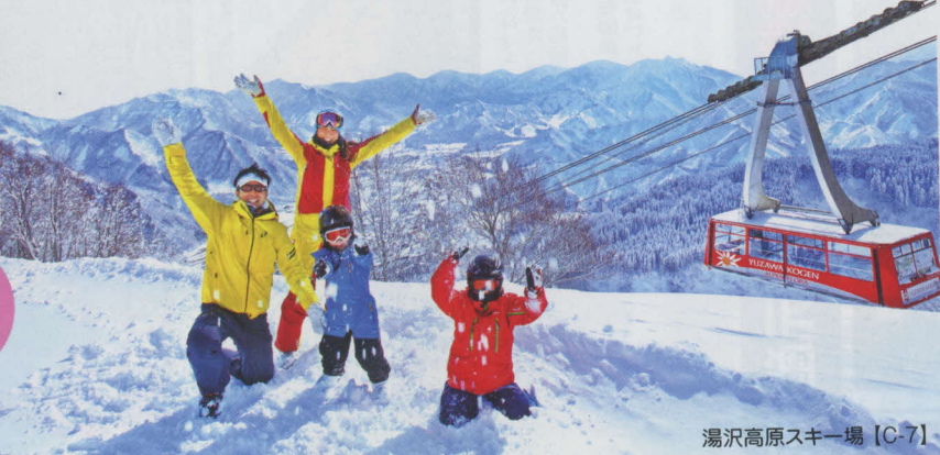
湯沢高原スキー場 [C-7]