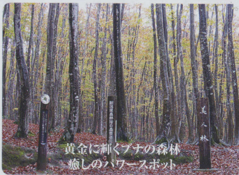
黄金に輝くブナの森林 癒しのパワースポット

奥只見湖を船で渡り、紅葉の山道を行く、新潟県側唯一の尾瀬ルート。高低差が少なく、日帰りも可能で、尾瀬を手軽に楽しめます。(奥只見郷ネイチャーガイド 有料・要予約) ☎魚沼市観光協会 ☎025-792-7300