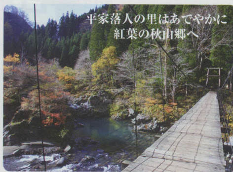
平家落人の里はあでやかに 紅葉の秋山郷へ

本店 / 十日町市本町4 TEL 025-757-3155 C-5 和(なごみ)亭 / 十日町市下島 TEL 025-757-1513 C-4 越後湯沢店 / 湯沢町(JR 駅構内) TEL 025-785-2081 D-7 http://www.hegisoba.co.jp