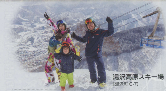
湯沢高原スキー場 【湯沢町 C-7】